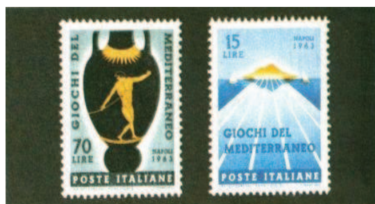
Deux timbres à célébrer les JM de Naples 1963